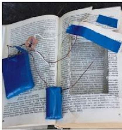
Спеціально встановлений вибухонебезпечний підривний засіб, (міна-пастка) замаскований в банки з-під кави та книжку