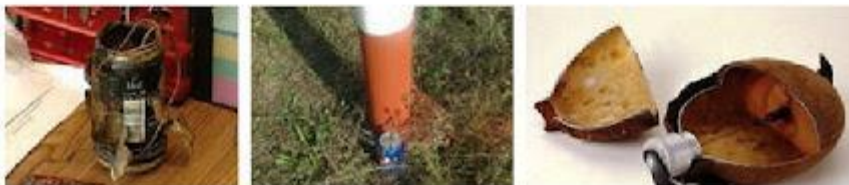
Спеціально встановлений вибуховий пристрій (міна-пастка) замаскований в жерстяну пляшку з-під напою та у флягу для води Зона можливого ураження в радіусі 100 м