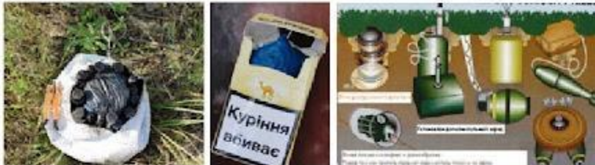
Замаскована міна-пастка у м'ячі, пачки з-під цигарок та основні види мінування. Зона можливого ураження в радіусі 150 м

МІНА-ПАСТКА - спеціальний пристрій, який може бути замаскований під безпечні на вигляд предмети побуту. Пристосований для того, щоб убивати чи завдавати ушкоджень. Спрацьовує раптово, коли людина торкається чи наближається до, начебто, нешкідливого предмета або здійснює, здавалося б, безпечну дію. Найчастіше встановлюються в будинках, спорудах, поблизу предметів повсякденного вжитку, зброї, дитячих іграшок.