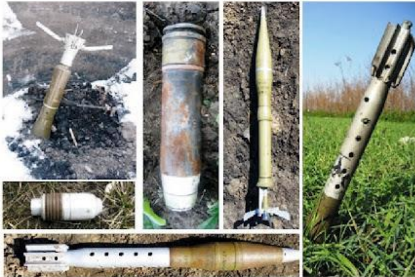
Постріли із гранатометів